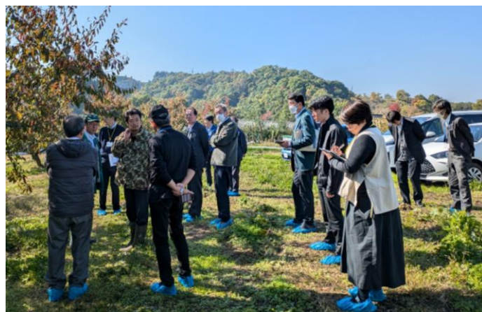
さくらんぼ農園現地視察の様子

福島県農業経営・就農支援センターでは本年度12月から2月にかけて、県内4ヶ所で「ふくしま農業経営継承セミナー」を開催することとしています。同セミナーの詳細は、ふくのうHPにて発信していきます。積極的なご参加をお待ちしています。