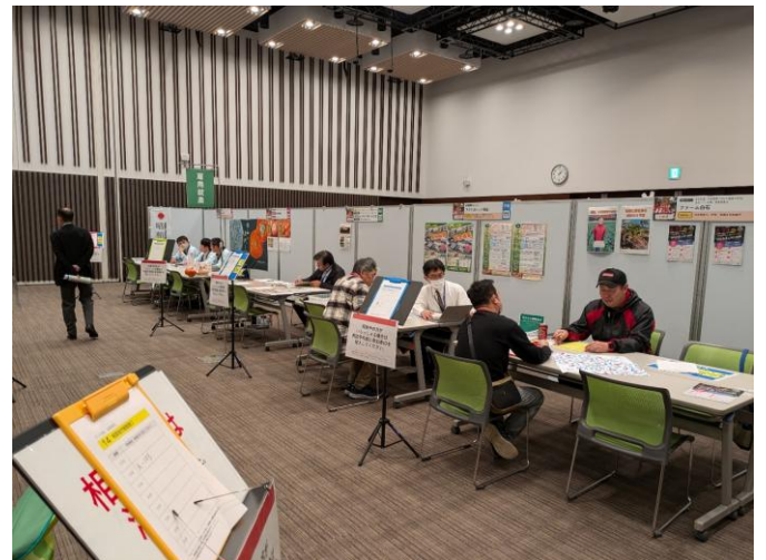
いわき市会場の様子

相談内容は必要に応じて相談カルテを作成し、関係機関・団体と共有することにより、連携して継続的に対応することとしています。引き続き、福島県における新規就農者の確保はもとより、近年相談が増加している農業経営の法人化や経営の継承の課題についても、きめ細かな対応を図ってまいります。