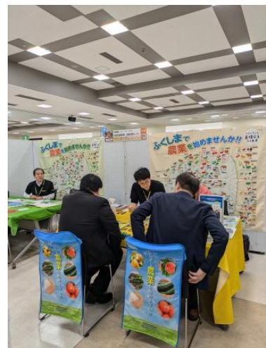
福島市会場の様子