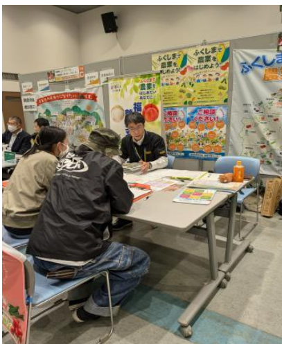
会津若松市会場の様子