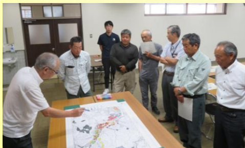
▲浅見川地区 協議の場 開催状況