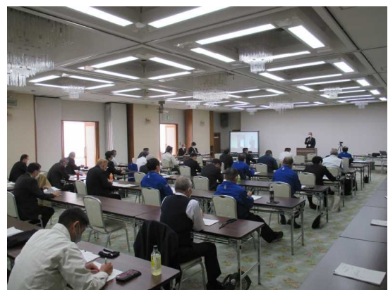
事業担当者説明会