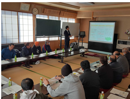
外部講師による集落での講演会