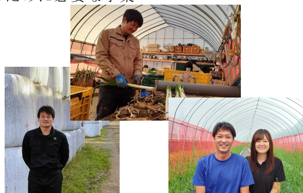
研修終了後、新たに就農された方々