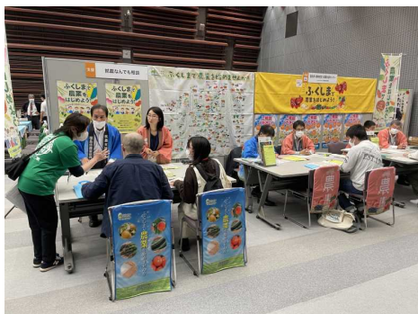
就農相談フェアにて