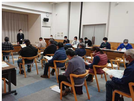
集落での事業説明