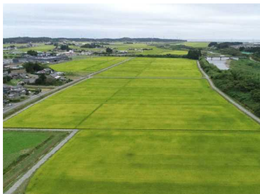
ほ場整備・農地集積後の水田ほ場