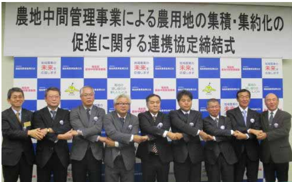
連携協定締結式の様子

更なる農用地の集積・集約化の推進を目指して！ ～ 担い手農業者 6 組織と連携協定を締結～