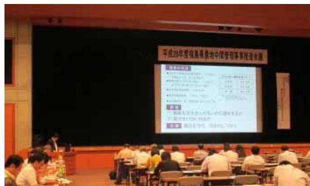
平成28年度農地中間管理事業推進会議 (パルセいいざか(福島市))

今後、出し手向けの事業周知チラシを作成し、県内の水田農家を中心にダイレクトメール等により配布する予定です。今後も関係者の皆様のご協力をよろしくお願いいたします。