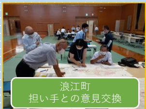
浪江町 担い手との意見交換