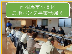
南相馬市小高区 農地バンク事業勉強会