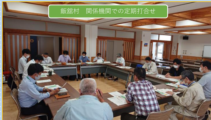
飯館村 関係機関での定期打合せ