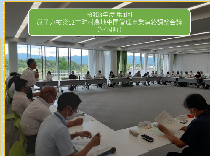
令和3年度 第1回 原子力被災12市町村農地中間管理事業連絡調整会議 (富岡町)