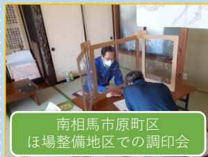
南相馬市原町区 ほ場整備地区での調印会