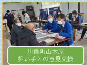
川俣町山木屋 担い手との意見交換